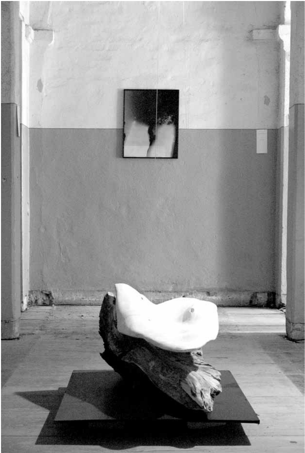
war es hier? Skulptur und Photogramm 7