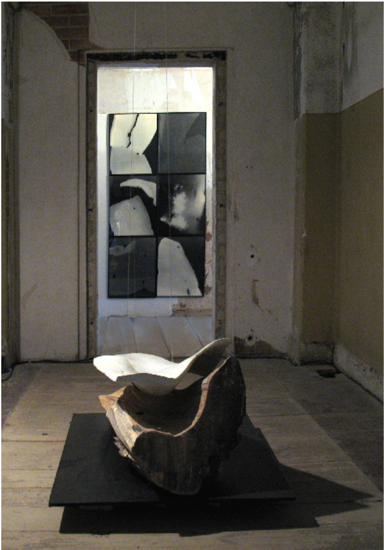
war es hier? Skulptur und Photogramme 1-6